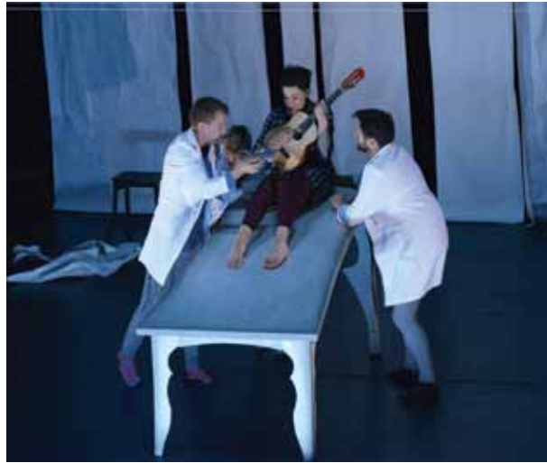
Danse, théâtre, dessin réunis sur scène à l'attention du jeune public lors du spectacle Alice sur le fil du Ballet des Zigues

En septembre, la Ville invite les enseignants à découvrir la programmation « Jeune Public » du théâtre municipal de Fontblanche, une programmation 2015 fondée sur 15 représentations, des rencontres avec les artistes ou encore des ateliers et expositions autour des spectacles. L'occasion aussi de détailler les activités des médiathèques et des écoles de musique, de danse et d'Arts plastiques.