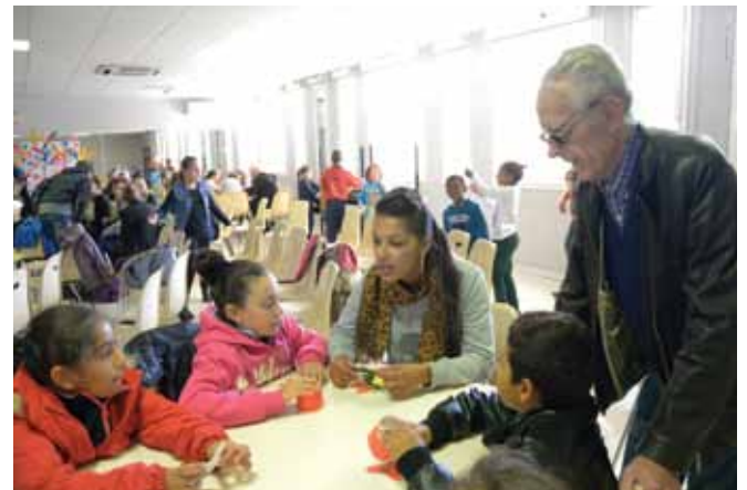
●●● Lors de la Journée du refus de la misère, le 14 octobre, les associations vitrollaises s'étaient mobilisées autour d'ATD Quart-Monde, devant le centre social du Bartas.