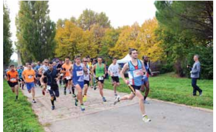
••• Premier semi-marathon de Vitrolles, le 25 octobre, sur le plateau, au profit de la recherche contre le cancer, sur une initiative du Rotary Club Vitrolles-étang et le club Vitrolles Sports athlétisme.