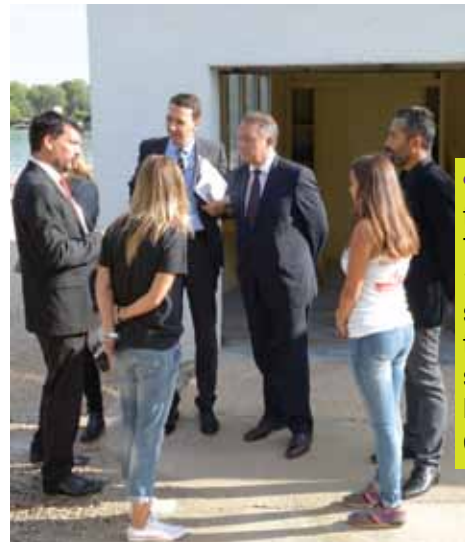
●●● Visite du Secrétaire d'Etat aux Sports, Thierry BRAILLARD, le 14 septembre, pour la signature des conventions deparcours d'insertion "SESAME" dans les secteurs du sport et de l'animation.