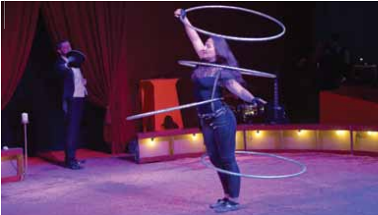
●●● Les 3 et 4 octobre, le cirque Piedon a fait une halte à Vitrolles.