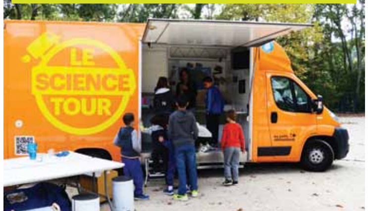
••• Le Science Tour proposé par l'association Les Petits Débrouillards, le 26 octobre, ou comment présenter la science de manière ludique et intéressante aux plus jeunes.