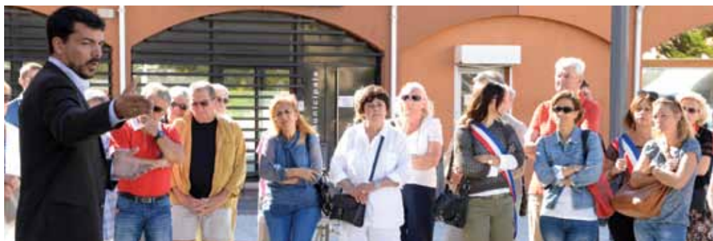
Journée nationale de mobilisation, le 29 septembre.

Comme vous le savez, j'ai décidé de m'associer à la mobilisation engagée par de très nombreux Maires de France face à la baisse des crédits que l'Etat accorde aux communes. La majorité municipale de Vitrolles a régulièrement exprimé comprendre les efforts de l'Etat pour réduire les déficits publics et limiter l'endettement de l'Etat.