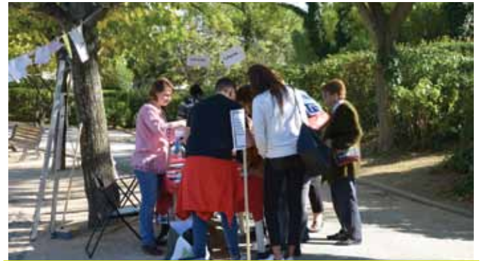
●●● Happening en extérieur le 7 octobre, au parc Saint-Exupéry, autour du thème "Liberté Liberté", préparé en partenariat avec les Médiathèques, plusieurs écoles de Vitrolles et l'Association pour la Promotion de l'Exposition de la maison Anne Frank.