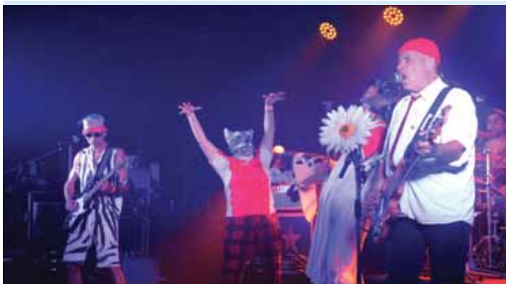
••• Concert de rock à la salle du Roucas, proposé par la MPT, dans l'esprit du mythique Sous-marin, le 24 octobre.