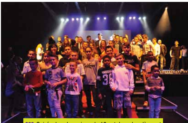
●●● Soirée des champions, le 10 octobre : la relève est assurée !