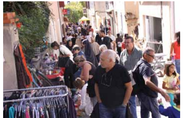
●●● Brocante, collectionneurs, artisanat au programme de la Foire aux objets d'hier et d'aujourd'hui, le 20 septembre, au vieux village.