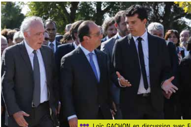
●●● Loïc GACHON en discussion avec François HOLLANDE, lors de sa visite au site-mémorial du camp des Milles, le 8 octobre, pour l'installation de la chaire universitaire Unesco « La mémoire au service de l'humanisme » dirigée par Alain CHOURAQUI, Président de la Fondation du Camp des Milles (à gauche sur la photo).