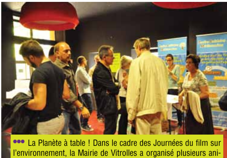
••• La Planète à table ! Dans le cadre des Journées du film sur l'environnement, la Mairie de Vitrolles a organisé plusieurs animations autour de la nourriture, de sa production locale et de sa consommation, début octobre.